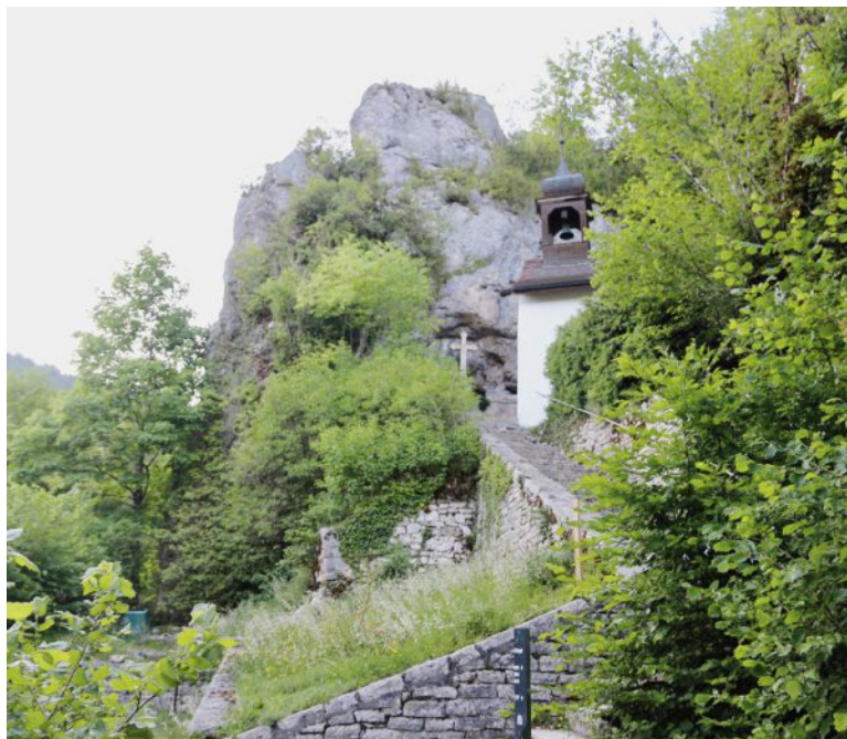
Au bout d'un sentier composé de 190 marches, la petite chapelle de l'ermitage accueille jusqu'à fin août les ermites d'un jour.