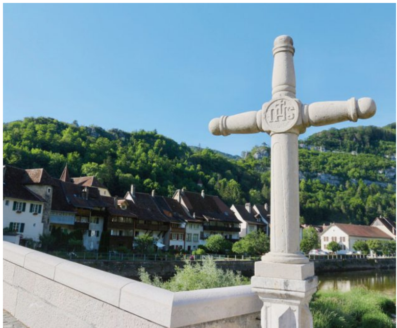
L'ermitage domine, en toute discrétion, la cité médiévale de Saint-Ursanne. Il se fond dans la masse de rochers et de verdure qui entoure la ville.